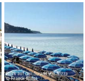
Blick auf den Strand von Nizza