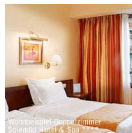
Wohnbeispiel Doppelzimmer Splendid Hotel & Spa