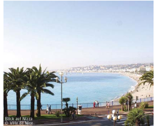
Blick auf Nizza

Das Splendid Hotel & Spa liegt zentral in Herzen der Stadt Nizza, nur ein paar Schritte vom Meer, dem berühmten Casino und der Fußgängerzone, entfernt. Komfortable Einrichtung und raffinierte Materialien prägen die Ausstattung der 128 Hotelzimmer, die in einem eleganten mediterranen Stil gestaltet sind und ganz den Charme der Côte d'Azur widerspiegeln. Alle Zimmer verfügen über Flachbildschirm, Satellitenfernsehen, WI-FI Internetzugang, Minibar, Balkon und Whirlbadewanne. Die Luxuszimmer verfügen über eine gemütliche Terrasse. Das Splendid Hotel & Spa Nice **** hat auch im Bereich Kulinarik einiges zu bieten. Im Restaurant "Chez Hugo" mit idealer Lage im obersten Stockwerk, genießen Sie vor allem mediterrane Küche und lokale Spezialitäten. Das Frühstück wird ebenfalls in dem im 8. Stockwerk gelegenen Restaurant serviert.