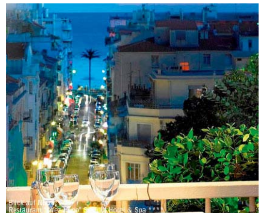
Blick auf das Restaurant "Chez Hugo" am Splendid Hotel & Spa ***