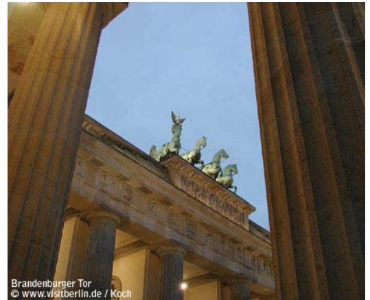
Brandenburger Tor