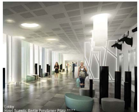
Lobby Hotel Scandic Berlin Potsdamer Platz ****